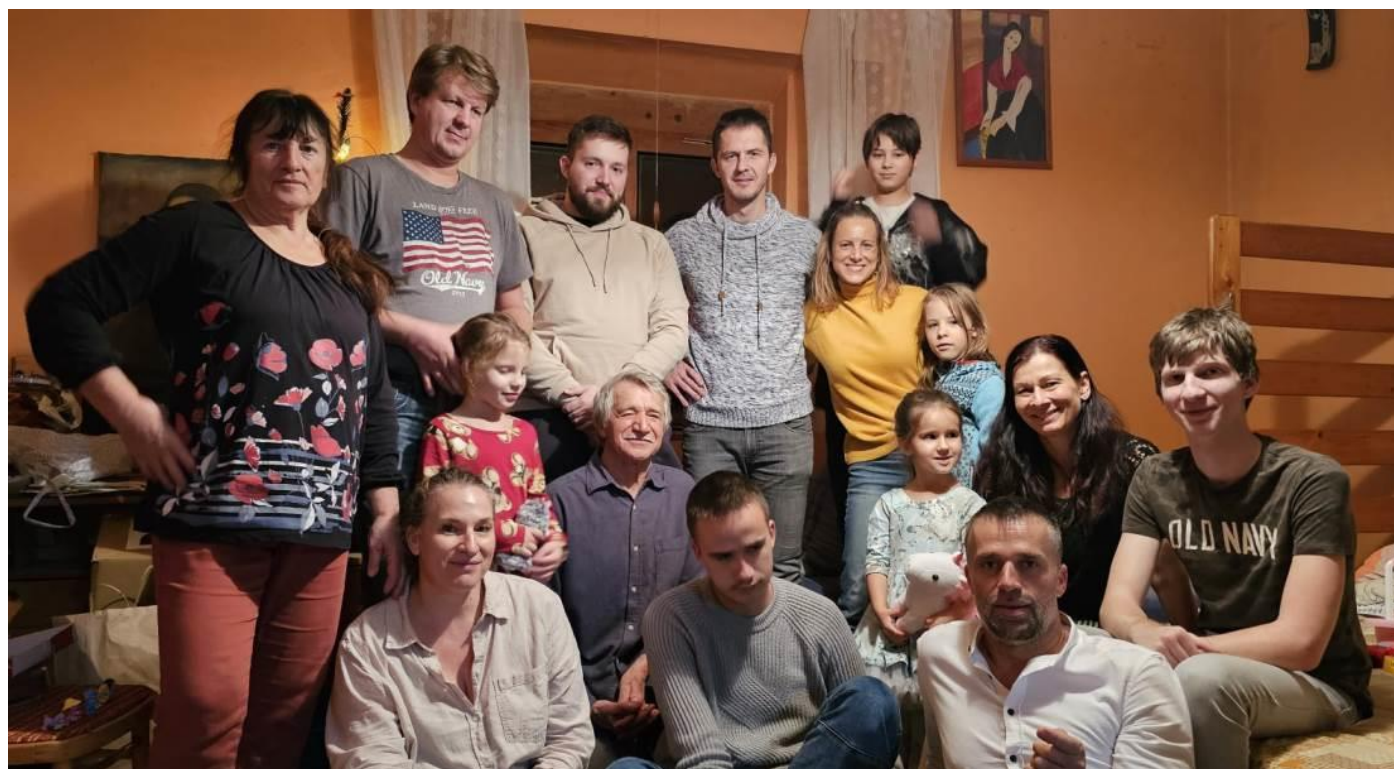
zabývaní a spokojní. Nasledoval deň na Taráni a v stredu sme skočili do Štitár za mamou, ktorý budúci rok